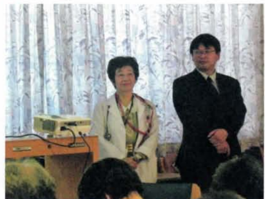
揖場施設長と倉本主任 ケアマネジャーの二人が講師