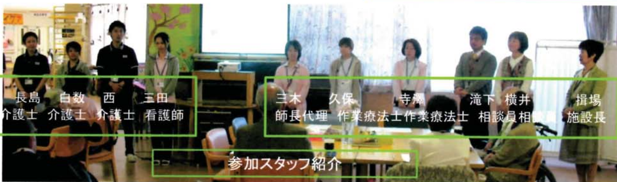
長島 白数 西 三田 介護士 介護士 介護士 看護師

普段、あまりお話する機会がないご家族様とスタッフがじっくり交流しました。ご家族様同士の交流もあり、知識だけではなく気持ちも共感し合えるデイケアの家族会でした。