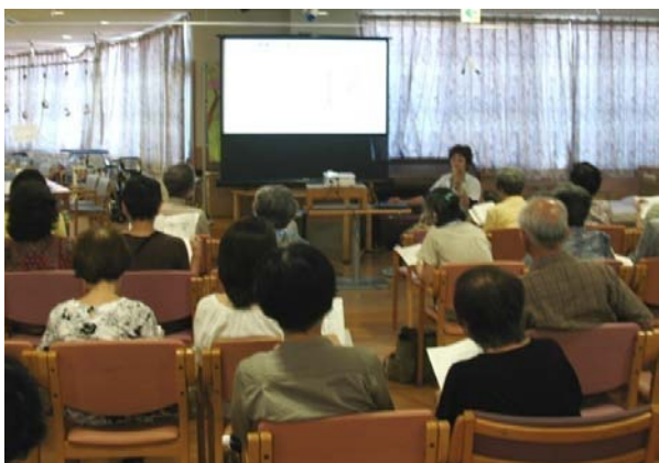
介護講演会の風景