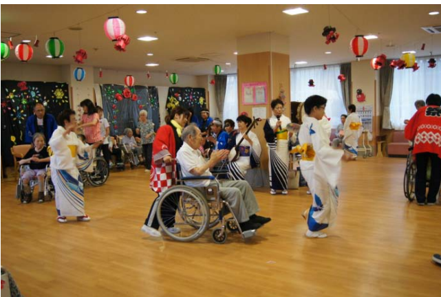
ご利用者様とボランティアさんによる盆踊り