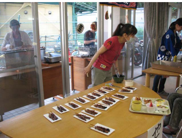
焼き鳥の販売 [炭火焼です!]