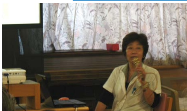
揖場施設長 講演1「骨密度について」

平成23年7月10日（日）に開催しました、第3回つくも介護講演会の様子を紹介します。