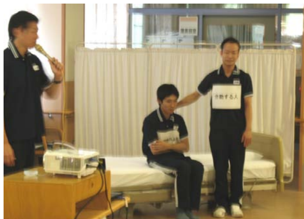
一丸介護福祉士 講演2 「介助者に優しい介護の仕方」