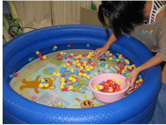
おもちゃすくいに興じるお子さんと おもちゃで一杯の桶