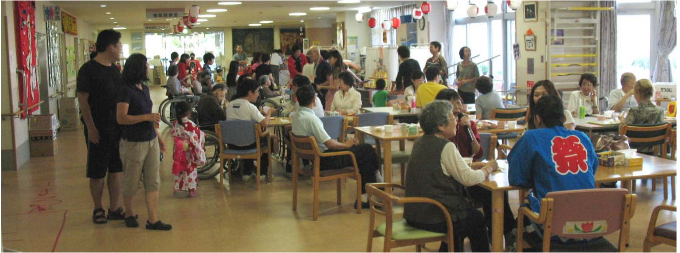
夏祭り一色の1階フロア [お祭りに華を添える浴衣姿のお子さんの姿も]