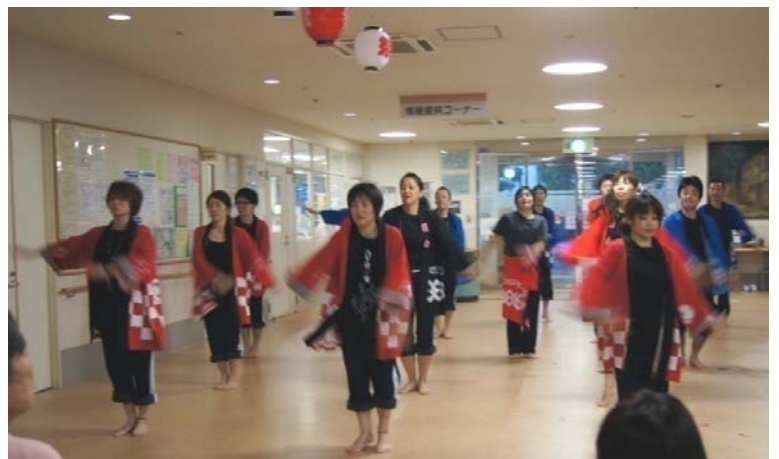
スタッフによるダンス [アンコールも頂きました!]