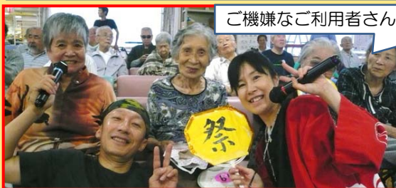
ご機嫌なご利用者さん&スタッフ

今年の初のコンセプトとして「豊年豊作」をテーマに七福神に見守られながら、他部署からの応援もあり無事に夏祭りを終えることができました。豊かな表情がたくさん実っていて、まさに「豊年まつり」でした♪