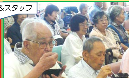
夏に涼やかな彩りを添えるかき氷