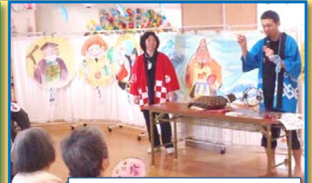
ジャンケン抽選大会の様子