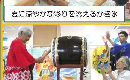
心が高ぶる太鼓の響き！ これが夏だよ、デイケアの祭り！