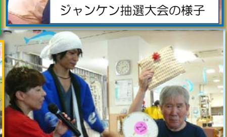
ジャンケン抽選大会の景品を高々に掲げるご利用者さん