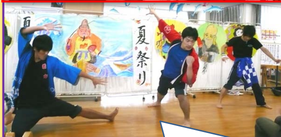
つくもスタッフによるアイドルユニット「つくもGENJI」の歌謡ショー♪ 歌って踊れるハイパフォーマンスグループだ！