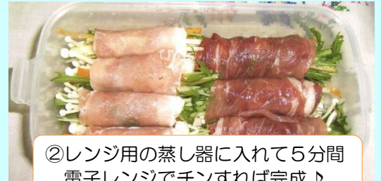
②レンジ用の蒸し器に入れて5分間電子レンジでチンすれば完成♪