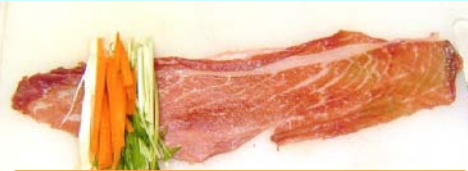
①材料をお肉に巻くだけ！超簡単！