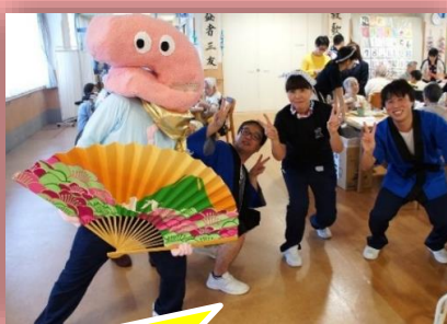
つくものゆるキャラ“つくもくん”と愉快的なスタッフたち★