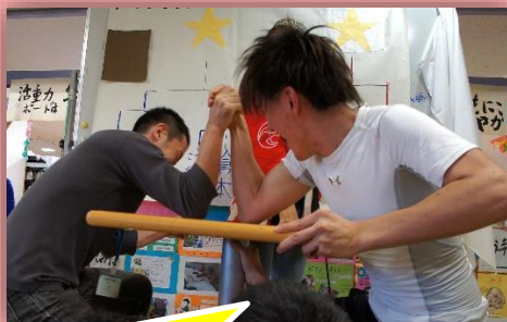
真剣勝負の腕相撲大会！白熱の試合の連続で会場は大盛り上がり！！