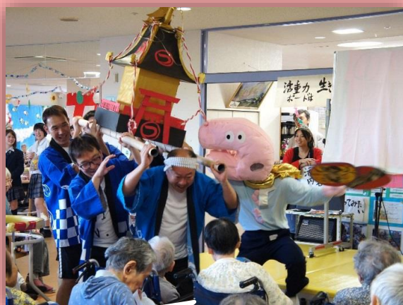
つくもの祭りは一味違う！つくもの魂が宿った男神輿が会場を勇壮に練り歩きました！