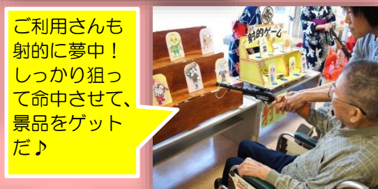
ご利用さんも射的に夢中！しっかり狙って命中させて、景品をゲットだ♪