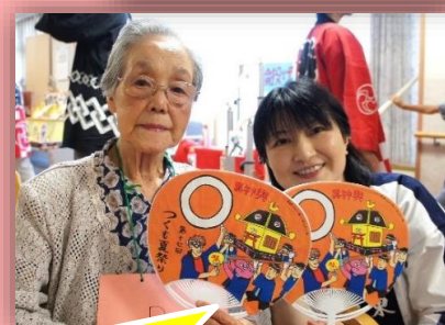
H28つくも夏祭り特製うちわを持って、記念撮影です(◎^ ^◎)