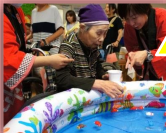
大人も楽しいおもちゃすくい(^.^)何個取っても飽きない面白さがあります！