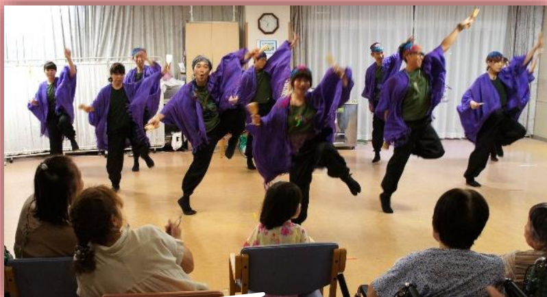
有志のスタッフで結成されたつくもダンスチーム“奏流(そうりゅう)”の迫力ある演舞♪夏祭りのフィナーレを飾りました！