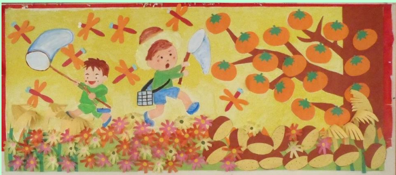
壁画『実りの秋』。デイケアご利用者さん達が作成。1階リハビリフロアに描かれた秋を感じさせる色紙をつかった大きな貼り絵です。