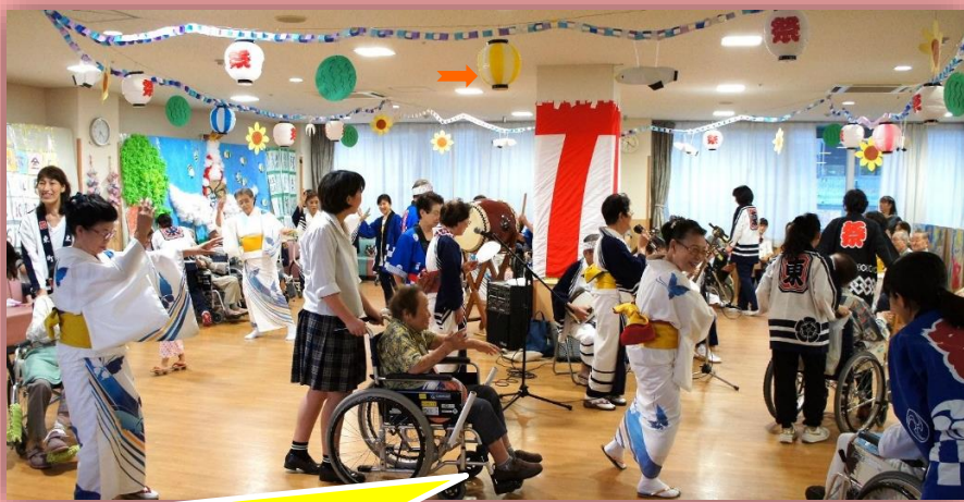
ボランティアの千里会さんの演奏に合わせて、みんな一緒に盆踊り！夏祭りならではの一体感を楽しみました \ (^.^) /