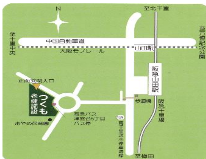
阪急山田駅 モノレール山田駅より 徒歩7分

介護老人保健施設つくも つくも通所リハビリテーション TEL 06-6872-0270 つくもヘルパーステーション TEL 06-6873-7773 つくもケアプランセンター TEL 06-6872-0281 吹田市津雲台・藤白台 地域包括支援センター TEL 06-7654-5350