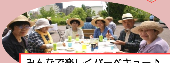
みんなで楽しくバーベキュー♪