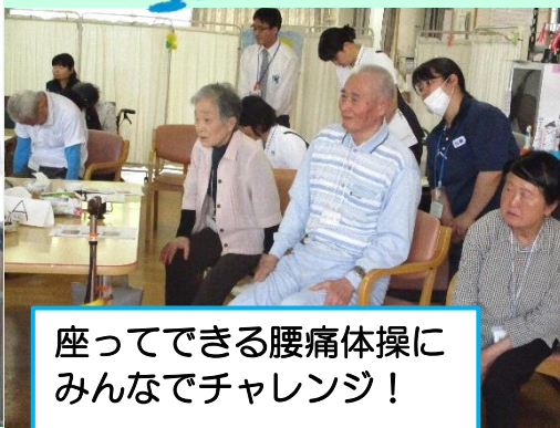
座ってできる腰痛体操に みんなでチャレンジ！

平成30年4月22日（日） ご本人様、家族様、11名の方 にご参加いただきました。お茶を 飲みながら、普段関わりの少な い職員と交流して頂くことがで きました。 毎年、年2回家族会を開催して います。次回もたくさんの方の ご参加をお待ちしております。