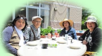
大西科長とマジックさん