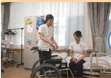
移動や移乗の練習

ご家族さまの困っていることや希望 など、たくさんお話できて、とても 有意義な家族会になりました。