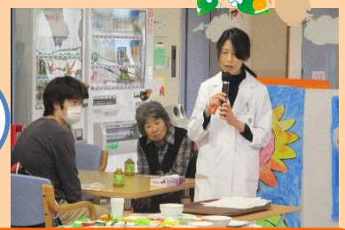
管理栄養士による栄養講座

ご家族さまの困っていることや希望 など、たくさんお話できて、とても 有意義な家族会になりました。