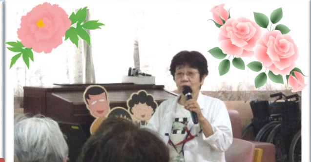
テーマ 『人生100年時代 フレイルって何？』