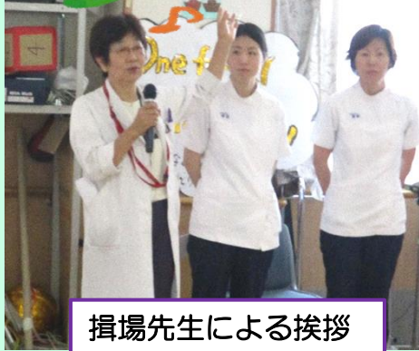
揖場先生による挨拶