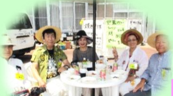
キャラバン三橋会さん