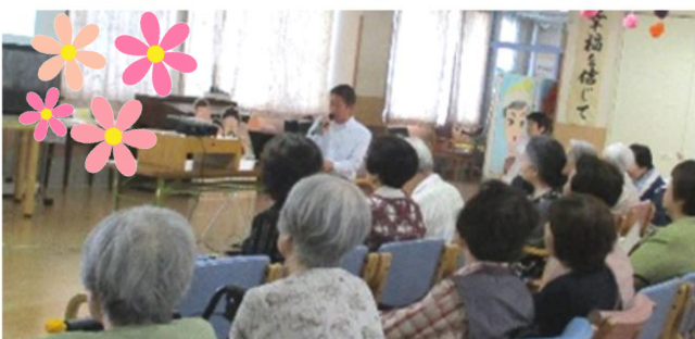
テーマ 『高齢になっても元気に働ける場をつくろう』