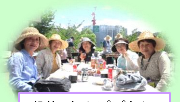
喫茶 たんぽぽさん