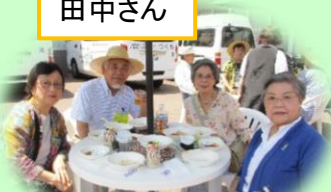
紙芝居やまぼうしさん