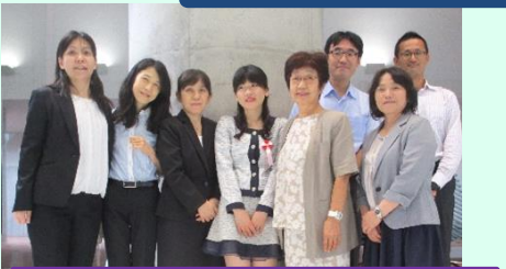
参加者みんなで記念撮影！