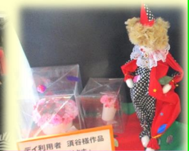
デイ利用者 須谷様作品 「かわいい人形さま」