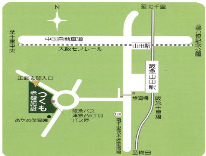
阪急山田駅 モノレール山田駅より 徒歩7分

介護老人保健施設つくも つくも通所リハビリテーション TEL 06-6872-0270 つくもヘルパーステーション TEL 06-6873-7773 つくもケアプランセンター TEL 06-6872-0281 吹田市津雲台・藤白台 地域包括支援センター TEL 06-7654-5350