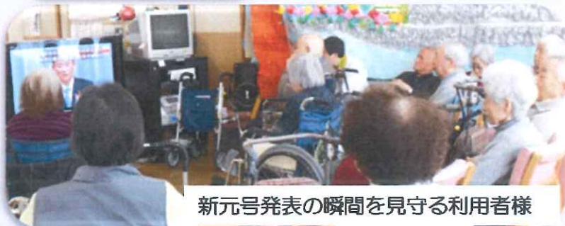
新元号発表の瞬間を見守る利用者様

平成から令和へ年号も変わっていきますが、今後とも老健つくもをよろしくお願いいたします。