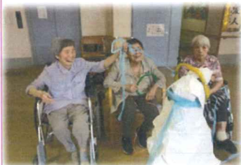
カウボーイの気分です!