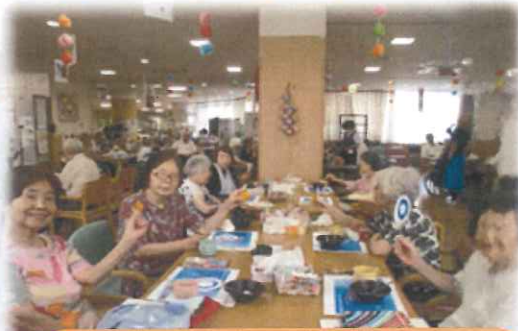
アメリカクイズ難しいわあ～♪