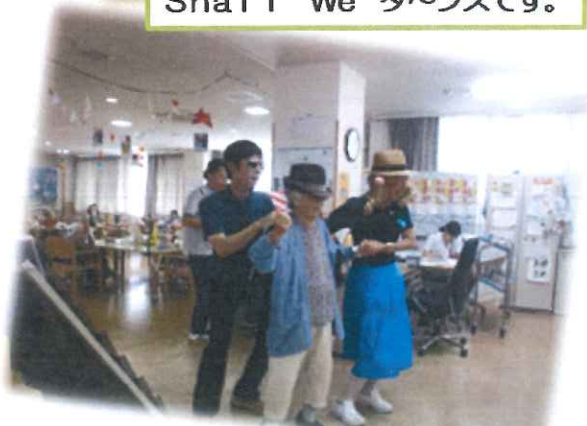
ダンスが得意だという意外な一面も垣間見 れました。♪