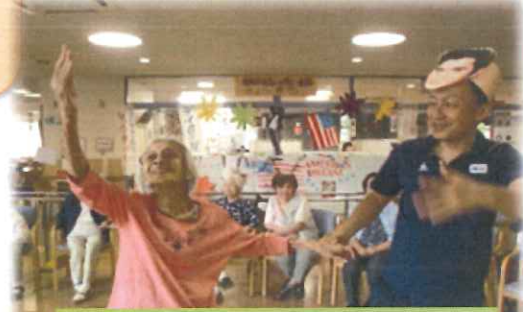
Shall We ダンスです。